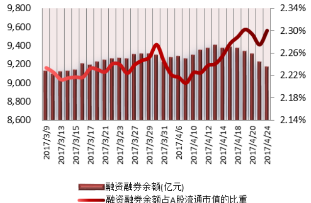
图 2：近三十个交易日融资融券余额及占 A 股流通市值的比重