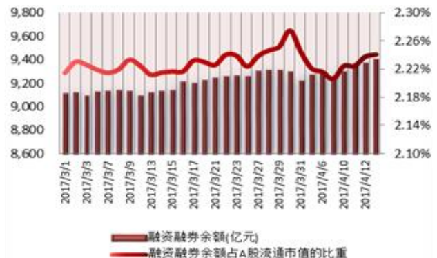
图2：近三十个交易日融资融券余额及占A股流通市值的比重