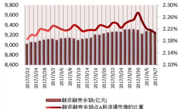
图2：近三十个交易日融资融券余额及占A股流通市值的比重