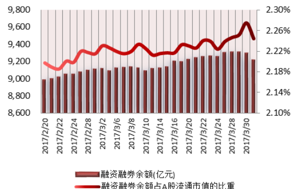
图 2：近三十个交易日融资融券余额及占 A 股流通市值的比重