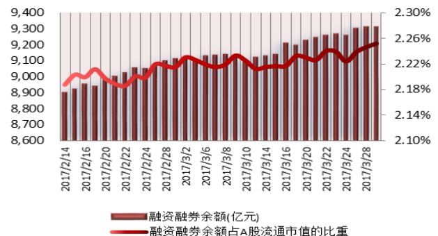
图2：近三十个交易日融资融券余额及占A股流通市值的比重