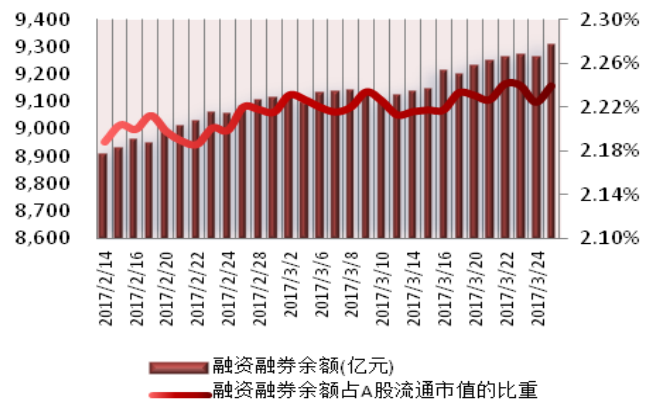
图2：近三十个交易日融资融券余额及占A股流通市值的比重