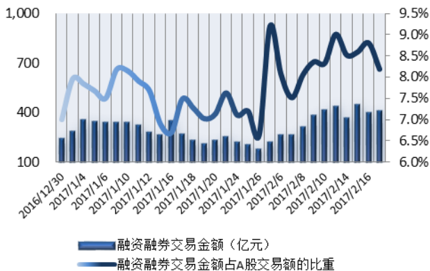
图1：近三十个交易日融资融券交易金额及占A股交易额的比重

注：1、上表“比重”指占担保品总价值的比重；2、“平均维持担保比例”指有融资融券负债客户的平均维持担保比例。