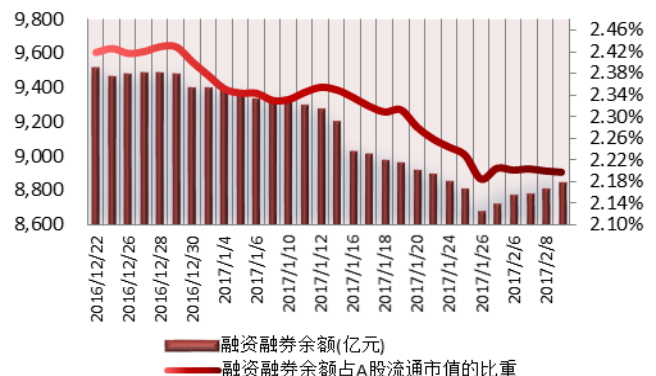
图 2：近三十个交易日融资融券余额及占 A 股流通市值的比重