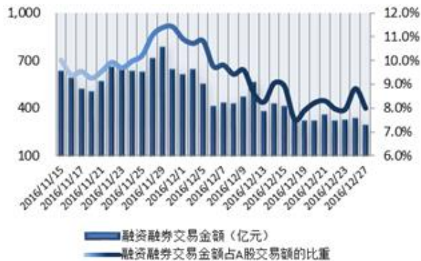
图 1：近三十个交易日融资融券交易金额及占 A 股交易额的比重

注：1、上表“比重”指占担保品总价值的比重；2、“平均维持担保比例”指有融资融券负债客户的平均维持担保比例。