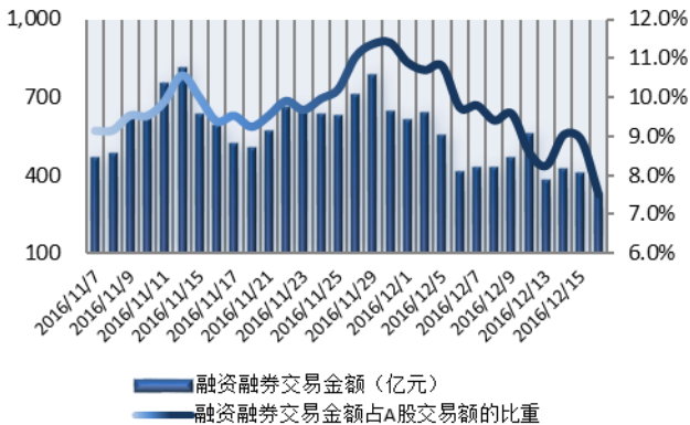
图1：近三十个交易日融资融券交易金额及占A股交易额的比重

注：1、上表“比重”指占担保品总价值的比重；2、“平均维持担保比例”指有融资融券负债客户的平均维持担保比例。