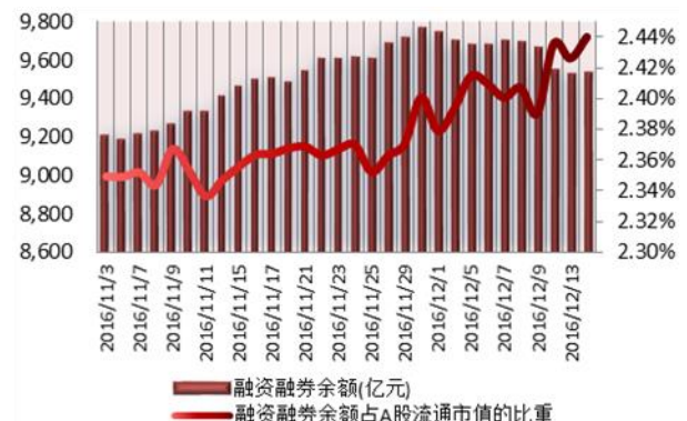
图2：近三十个交易日融资融券余额及占A股流通市值的比重