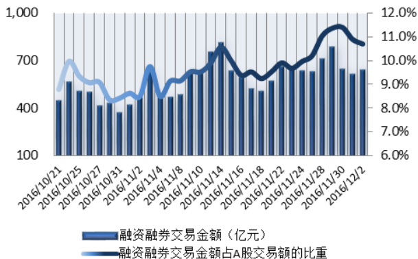
图 1：近三十个交易日融资融券交易金额及占 A 股交易额的比重

注：1、上表“比重”指占担保品总价值的比重；2、“平均维持担保比例”指有融资融券负债客户的平均维持担保比例。