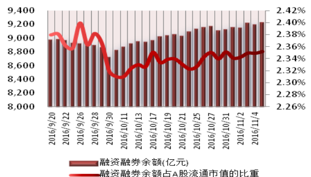
图2：近三十个交易日融资融券余额及占A股流通市值的比重