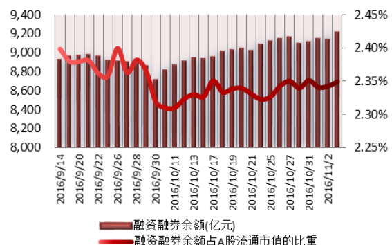
图2：近三十个交易日融资融券余额及占A股流通市值的比重