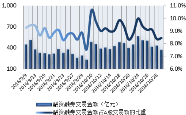
图 1：近三十个交易日融资融券交易金额及占 A 股交易额的比重