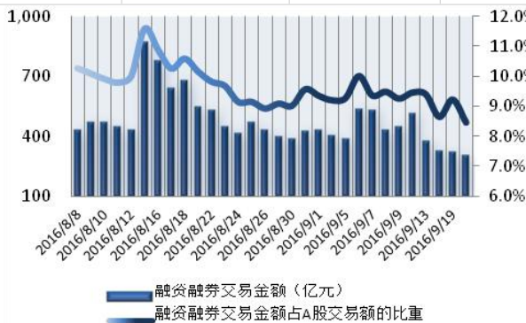
图1：近三十个交易日融资融券交易金额及占A股交易额的比重