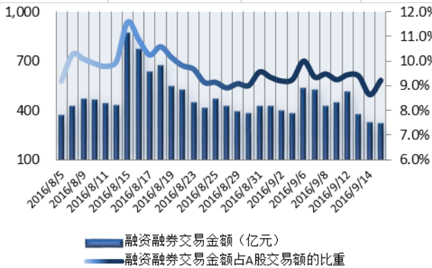
图 1：近三十个交易日融资融券交易金额及占 A 股交易额的比重