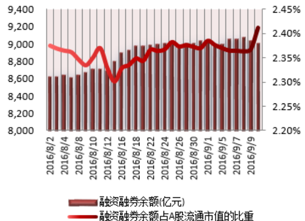
图2：近三十个交易日融资融券余额及占A股流通市值的比重