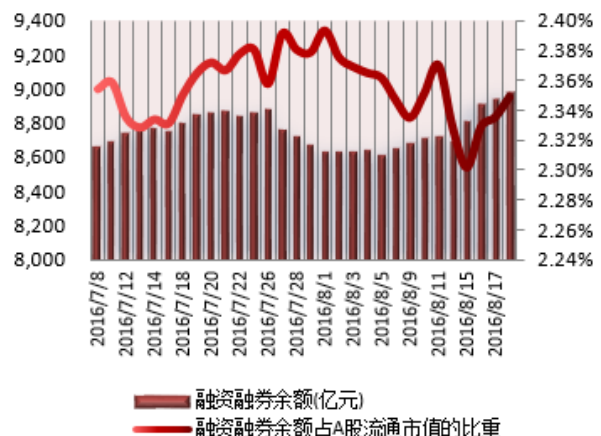
图2：近三十个交易日融资融券余额及占A股流通市值的比重