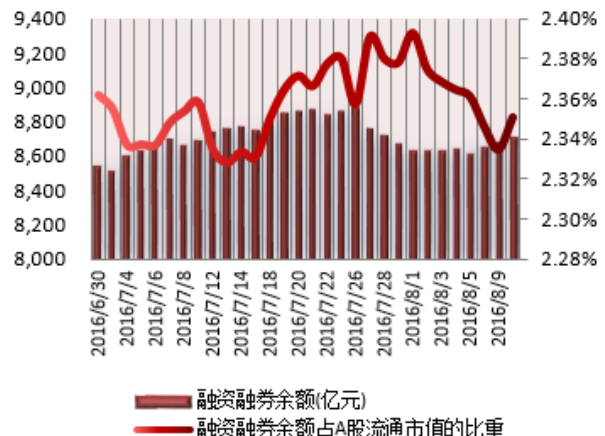
图 2：近三十个交易日融资融券余额及占 A 股流通市值的比重