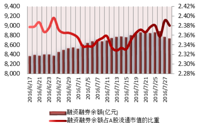
图 2：近三十个交易日融资融券余额及占 A 股流通市值的比重