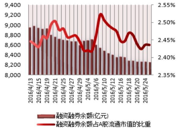
图 2：近三十个交易日融资融券余额及占 A 股流通市值的比重