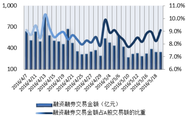
图 1：近三十个交易日融资融券交易金额及占 A 股交易额的比重