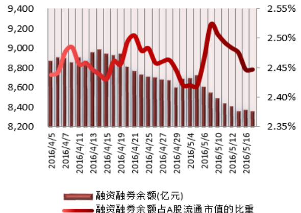
图2：近三十个交易日融资融券余额及占A股流通市值的比重