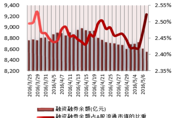
图 2：近三十个交易日融资融券余额及占 A 股流通市值的比重