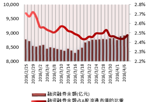
图 2：近三十个交易日融资融券余额及占 A 股流通市值的比重