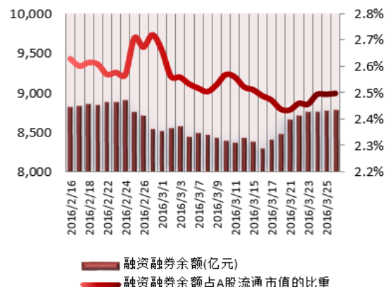
图 2：近三十个交易日融资融券余额及占 A 股流通市值的比重