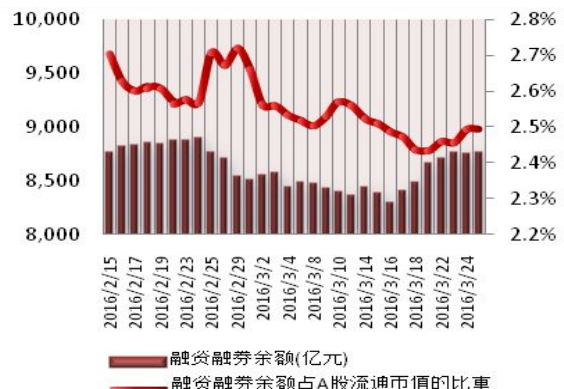
图2：近三十个交易日融资融券余额及占A股流通市值的比重