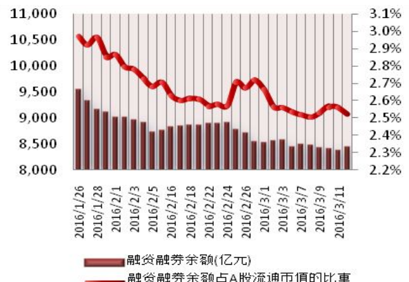
图 2：近三十个交易日融资融券余额及占 A 股流通市值的比重