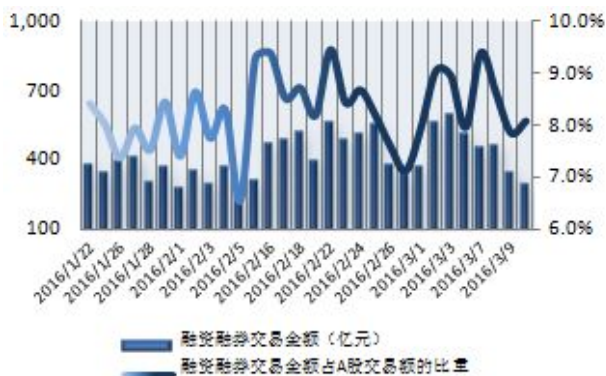
图1：近三十个交易日融资融券交易金额及占A股交易额的比重