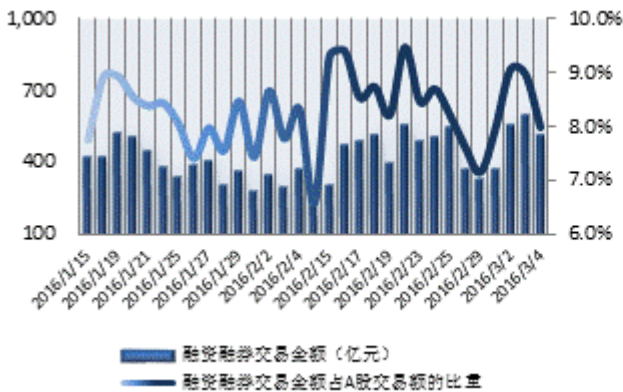
图1：近三十个交易日融资融券交易金额及占 A 股交易额的比重