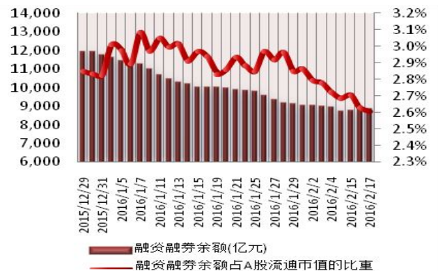
图2：近三十个交易日融资融券余额及占A股流通市值的比重