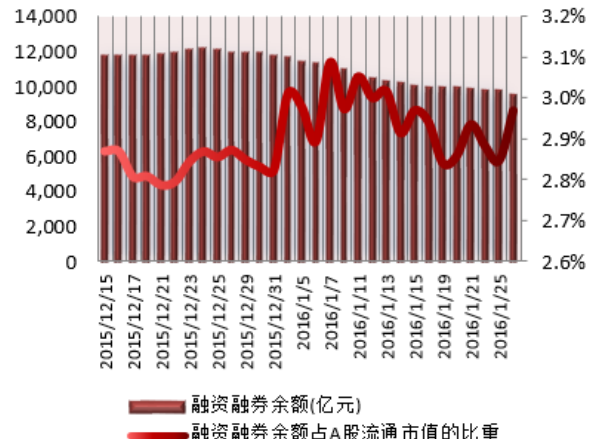
图 2：近三十个交易日融资融券余额及占 A 股流通市值的比重