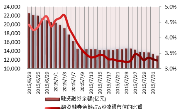
图2: 近三十个交易日融资融券余额及占A股流通市值的比重