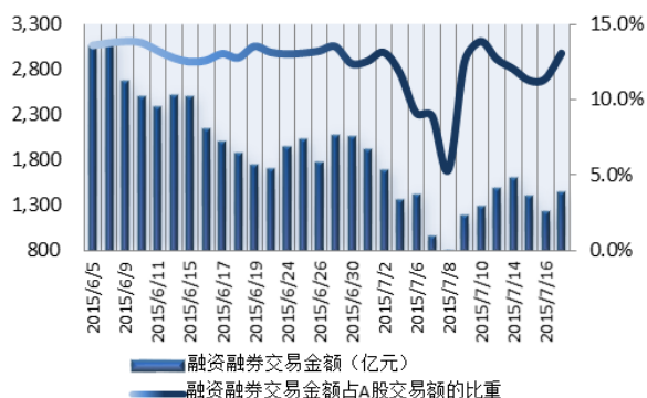
图1: 近三十个交易日融资融券交易金额及占A股交易额的比重