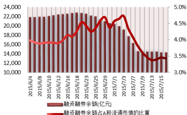
图 2：近三十个交易日融资融券余额及占 A 股流通市值的比重