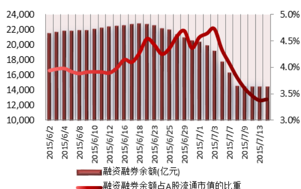
图 2: 近三十个交易日融资融券余额及占 A 股流通市值的比重