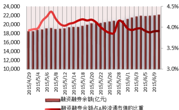
图 1：近三十个交易日融资融券交易金额及占 A 股交易额的比重